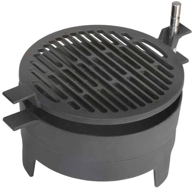
MORSØ GRILL '71 TABLE